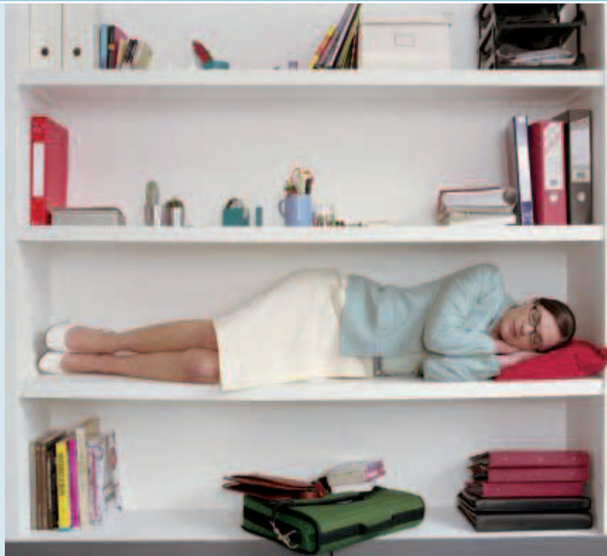
Nicht jede Erschöpfung ist ein Burn-out Syndrom.

Wobei nicht jede Überbelastung, Müdigkeit und Gereiztheit gleich ein Burn-out Syndrom sein muss. Im Interview auf Seite 2 erklärt der Psychiater Waldemar Greil, dass Burn-out keine eigentliche Krankheit, sondern eher ein modischer Sammelbegriff für verschiedene Erschöpfungssymptome ist und räumt dabei mit ein paar Vorurteilen zum Thema auf.